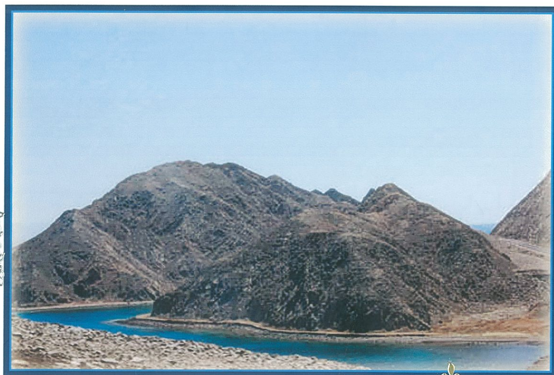
Бухта в Красном море