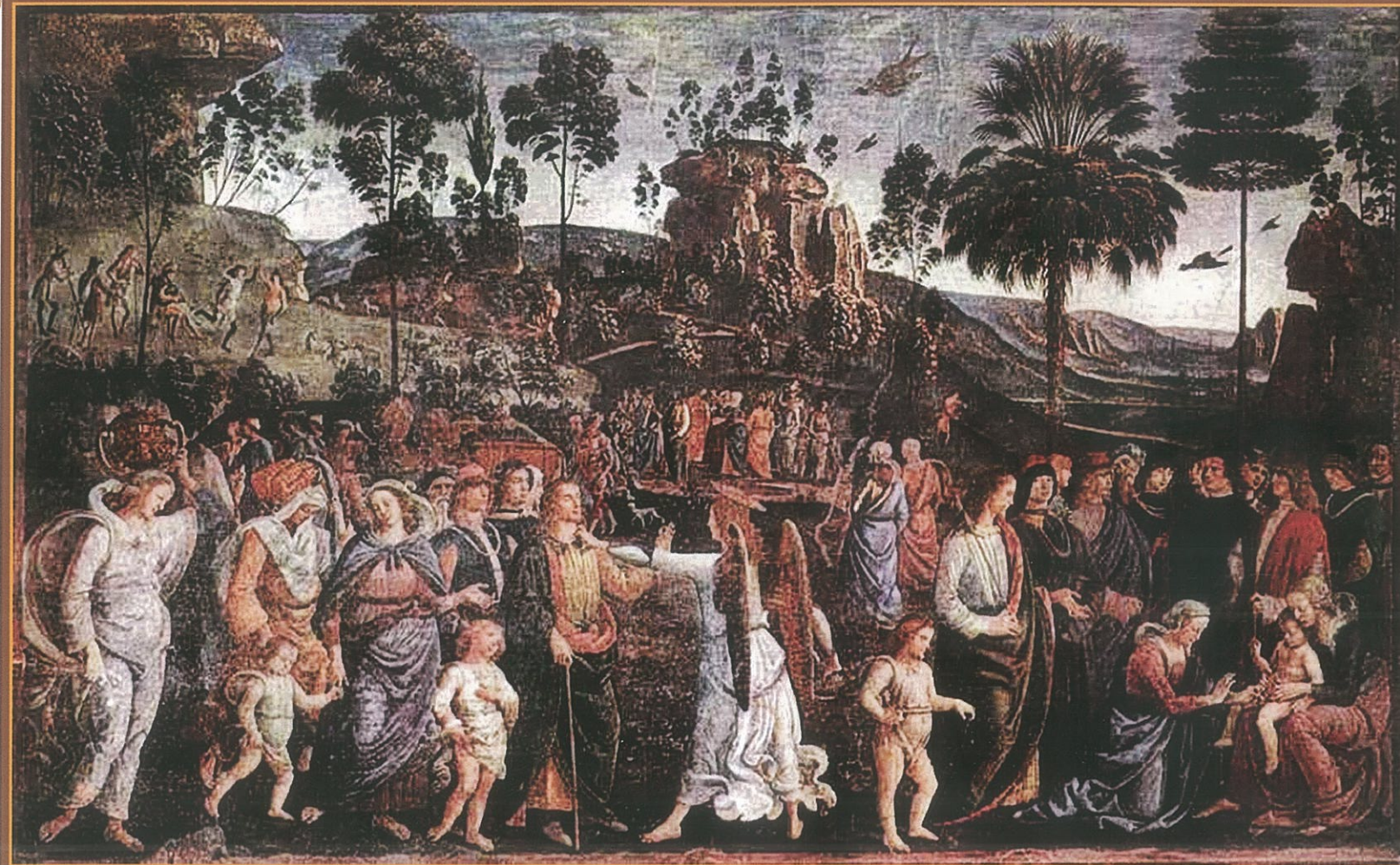
Пьетро Перуджино [1445-1523]. «Исход Моисея из Египта». Сикстинская капелла, Ватикан