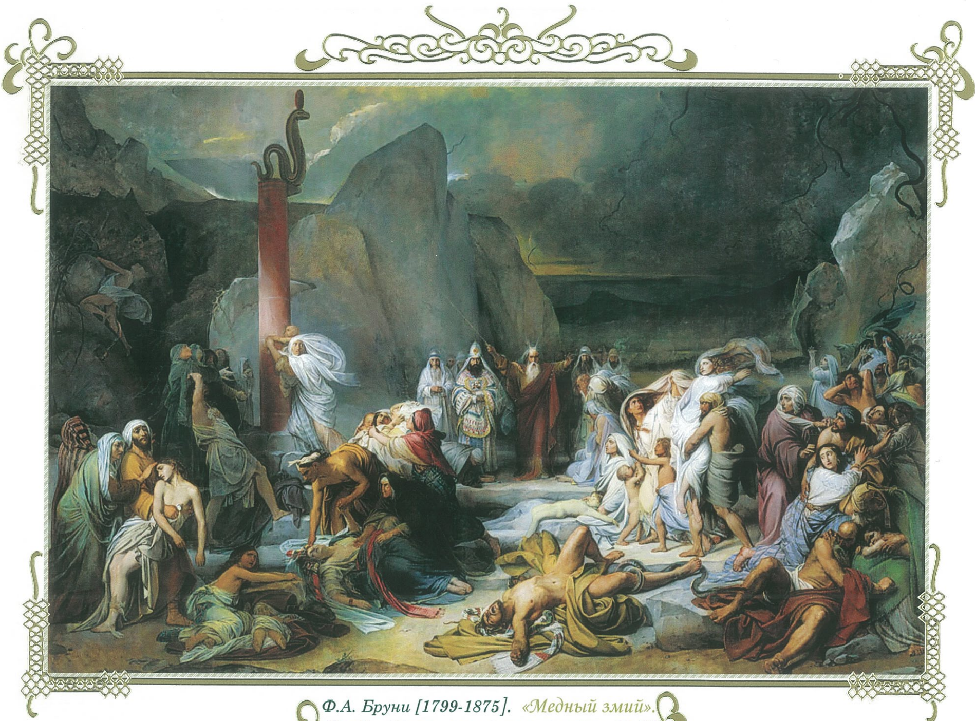
Ф.А. Бруни [1799-1875]. «Медный змий».