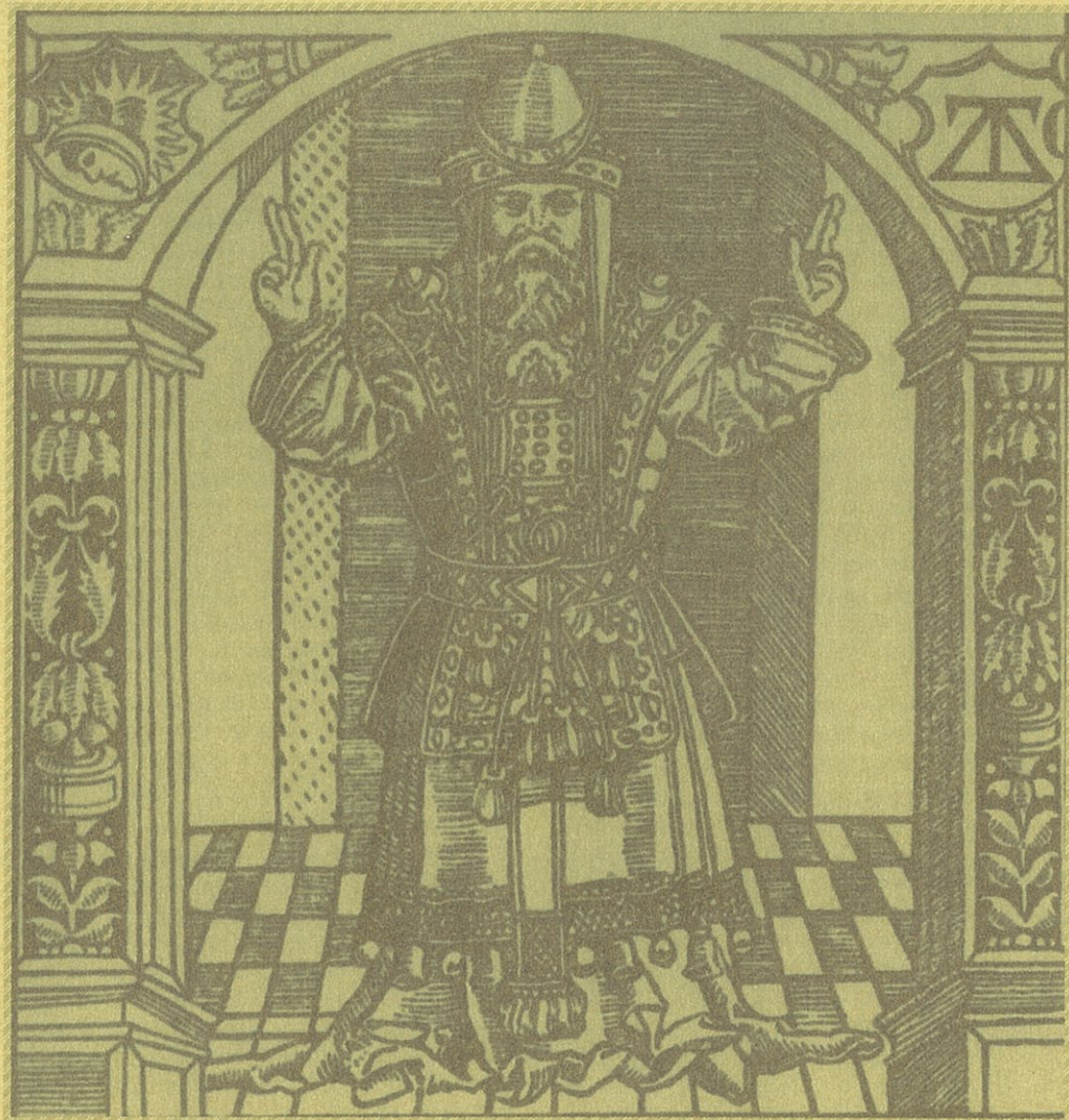
"Сей есть Аарон"

Из «Книги третие Моисеовы, зовемыя Леувить».