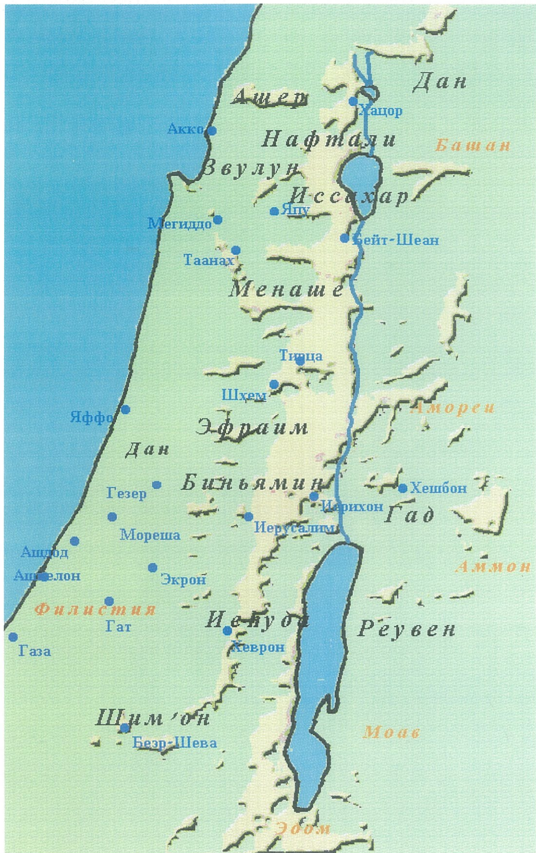
Расположение «колен израилевых» после вторжения евреев в Палестину