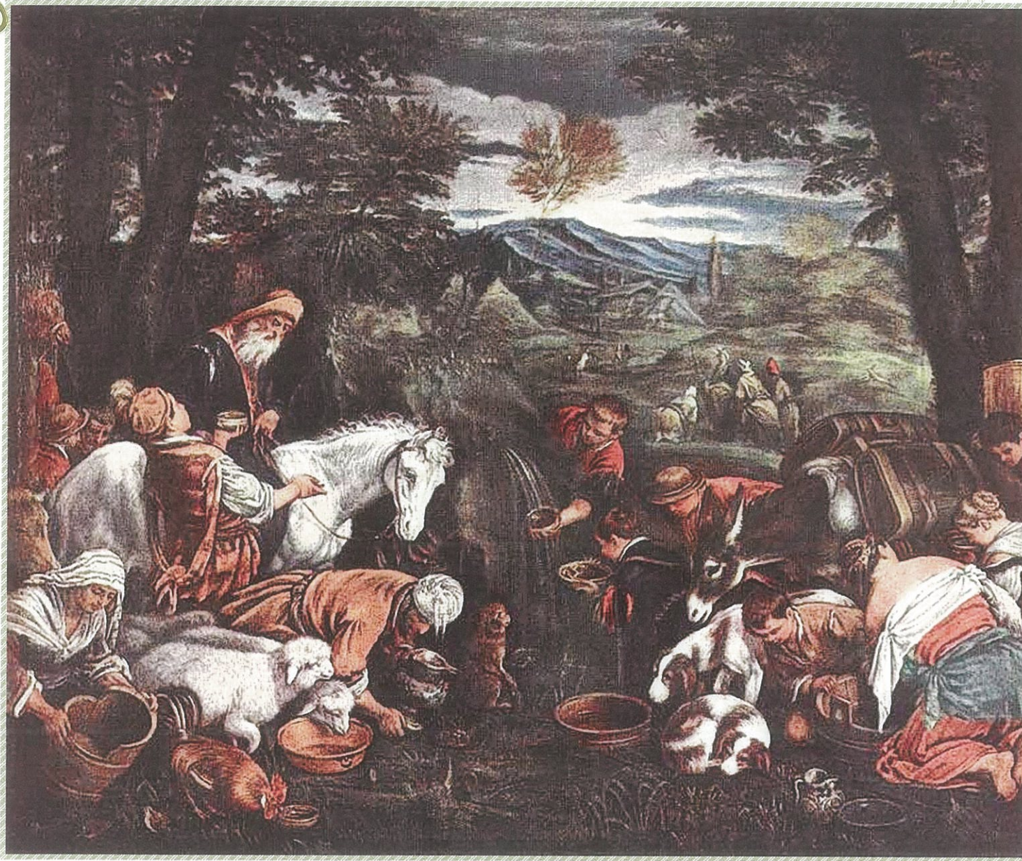
Бассано Леандро. «Моисей добывший воду из скалы». Лувр, Париж.