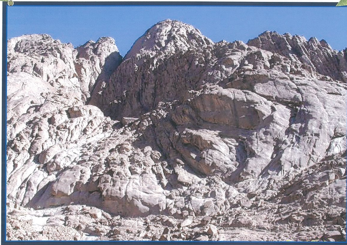
Гора Синай [вид от монастыря Святой Екатерины].